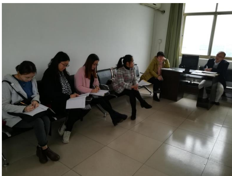
物流人文艺术学院的老师们在就示范课研讨

此次听评课教研活动的开展，使老师们在比较、反思和研讨的过程中，思维得以碰撞，灵感得以激发，促进了教师的专业成长，也提高了教师的教学水平。